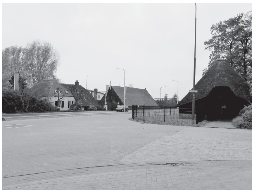
Remmerden, de vindplaats van het pistool.

Als instructiemateriaal gaf de Koninklijke Militaire Academie een voorschrift uit van 42 pagina's, waarin de mechanische werking van het wapen en alle onderdelen tot in