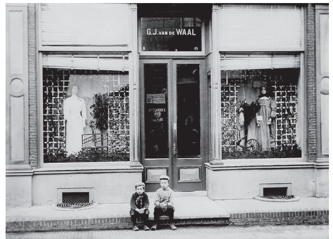
De etalage van de manufacturenwinkel in de Herenstraat.