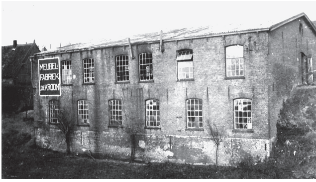
Meubelfabriek De Kroon.

betrekking krijgen bij een damestehuis in Den Haag, waar ook hun moeder mocht komen wonen. Huis en winkelpand leverden niet meer op dan 10 500 gulden; de winkelvoorraad en een groot deel van de inboedel van het huis werden bij opbod verkocht. Vijfjaar later werd het hele huis bij gevechten vernietigd.