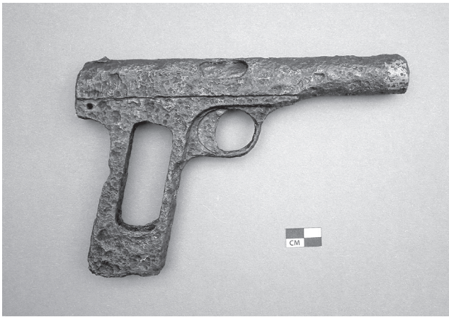
Het wapen na de restauratie.

Begin vorige eeuw stelde Browning bij Colt de productie van een nieuw pistool voor. Hij kreeg echter geen toestemming en week daarom uit naar de Belgische fabrikant FN. Deze nam het in productie onder de naam 'Pistolet Browning FN mle 1910' en voerde het uit in twee kalibers: 9 mm-kort en de 7,65 mm. Colt zal haar beslissing nog wel eens hebben betreurd, want ook Model 1910 bleek zeer succesvol en werd tot in 1985 door FN geproduceerd. Ook historisch gezien is Model 1910 een wapen van betekenis, omdat het dit type pistool was waarmee op 28 juni 1914 prins Franz Ferdinand van Oostenrijk werd vermoord in Sarajevo, wat nog altijd wordt gezien als de aanleiding tot de Eerste Wereldoorlog.