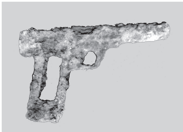
Het pistool zoals het uit de grond kwam.