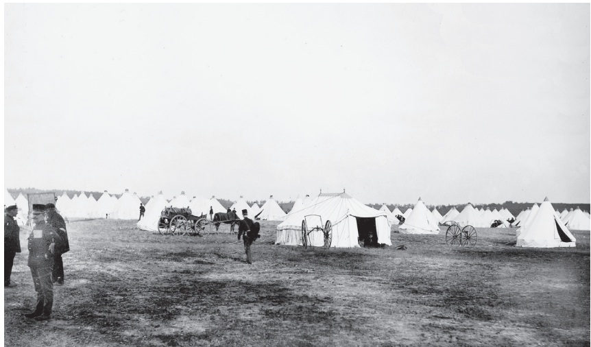
Tentenkamp ten noorden van Elst.

In de nacht van 20 op 21 september nam de oefening, of eigenlijk de oorlogstoestand, een aanvang en konden de beide divisies in beweging komen. Door verkenningen moest men op de hoogte komen van de vijandelijke troepenbewegingen. Veel van deze verkenningen gebeurden nog door de cavalerie, maar deze uit paarden bestaande eenheden kregen steeds meer concurrentie van de wielrijders. Een van de afspraken voor beide partijen was dat de spoorbrug bij Rhenen als vernietigd moest worden beschouwd en daardoor niet gebruikt kon worden. Ook de veren bij Rhenen en Ingen/Elst mochten niet voor de oversteek van troepen worden gebruikt. Het weer zat helaas niet mee. Na een lange periode van droogte vielen er die nacht stevige buien. De voor ons onbekende journalist van 'Het Nieuws van de Dag' deed vanaf de veranda van hotel De Grebbe verslag van de eerste uren. Medelij had hij met de marcherende troepen, omdat de wegen na de lange droge tijd nu door de hevige buien in modderpoelen waren veranderd. Hij genoot van de schitterende omgeving en luisterde goed naar de berichten van kapitein Van Tuinen. Het was een komen en gaan van huzaren en automobielen, zoals hij schreef. Zijn eerste bericht kon hij nog net meegeven aan een tram van de Ooster-Stoomtram Maatschappij, zodat het nog op tijd bij de drukkerij kon komen. Op sommige berichten zat een embargo om maar vooral te voorkomen dat de tegenstander via de pers geïnformeerd zou worden