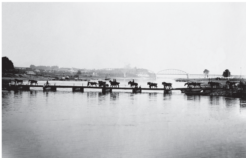
Te voet, te paard en per rijwiel trok men de ponton over. (Coll. H. P. Deys).

vragen, 'Wat hebben jullie vandaag gegeten? Bonen met vlees uit keukenwagens of hooikist?' Kreeg hij het antwoord: 'Uit de hooikist, excellentie.' 'Was het smakelijk?' 'In sommige ketels te hard'. Om vijf uur in de morgen keerde de minister weer terug in De Koning van Denemarken te Rhenen om daar snel een ontbijt te nuttigen en vervolgens weer te paard de troepenbewegingen verder te bekijken. De terugtrekkende troepen van de rode partij werden daarbij zo bedreigd door de blauwe eenheden dat de pontonbrug bij Remmerden werd opgeblazen (in feite het losmaken van het middenstuk). In de buurt van de pontonbrug te Rhenen bij het veer was het niet alleen druk met militairen, maar stond het ook zwart van belangstellenden. De veerman, die niet mocht varen, ontving honderden dubbeltjes van alle mensen die overstaken. In het koffiehuis bij het veer waren te weinig mensen om alle bezoekers te kunnen bedienen. Tijdens een regenbui passeerde koningin Wilhelmina bij de pontonbrug, wat tot spontaan gejuich en gewuif leidde.