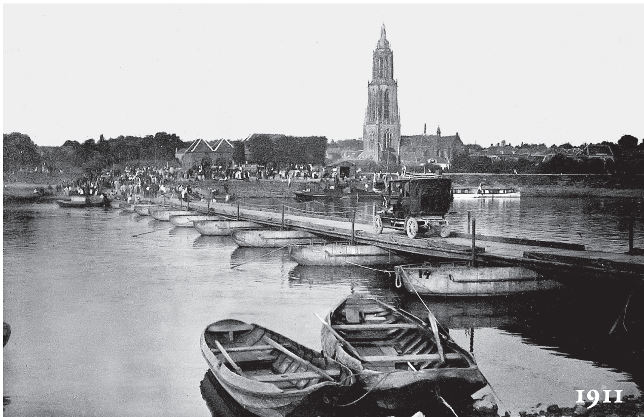
Een van de particuliere automobielen, die voor deze oefening werden gevorderd, rijdt over de ponton bij het veerhuis op 26 september 1911.

Bijna honderd jaar later, op 1 september 2011, is er opnieuw een oefening van de Genie te Rhenen, waarbij voertuigen de rivier worden overgezet. De operatie werd uitgevoerd door de 105 brugcompagnie uit Vught.