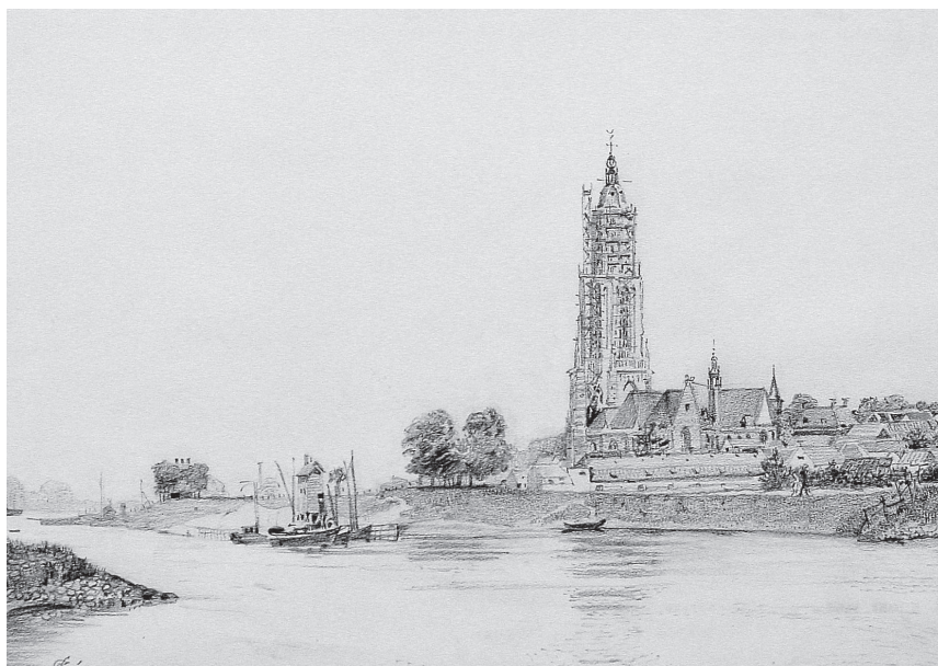
'Gezicht op Rhenen vanuit de Betuwe', S. de Clercq, 1938, potlood op papier. (Museum Het Rondeel, bruikleen Stichting Vrienden van Streekmuseum het Rondeel).

langs Rhenen voeren, werd Jan bij de loswal afgezet en voeren vader en moeder door naar Rotterdam, als ze dat die dag nog konden halen. Maar alleen 's zaterdags mocht hij van boord springen; andere dagen werd er gewoon doorgevaren, want er moest ook nog gewerkt worden.