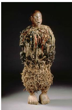
Het spijkerbeeld uit DR Congo