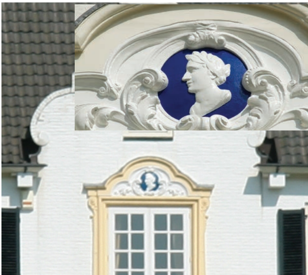
Kamer genoemd. Gevelversiering van het huis De Tangh, afkomstig van het huis Heerenstraat 96.