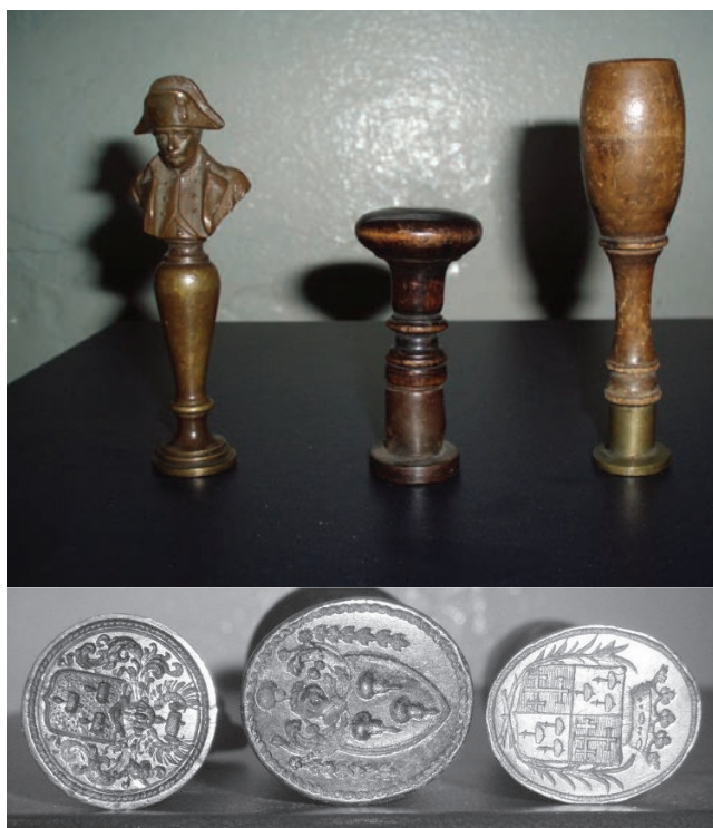
Enkele zegelstempels gebruikt door leden van de familie Menso.