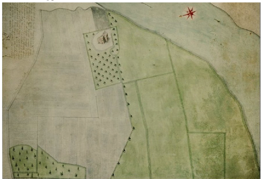
Tekening van het landgoed De Blauwe Kamer gemaakt in 1636 door Paulus Ruysch.