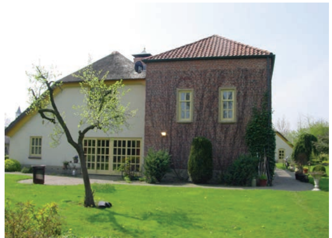
De boerderij Stuivenes vlak voor de sloop van de boerderijwoning en de huidige situatie na renovatie/nieuwbouw.