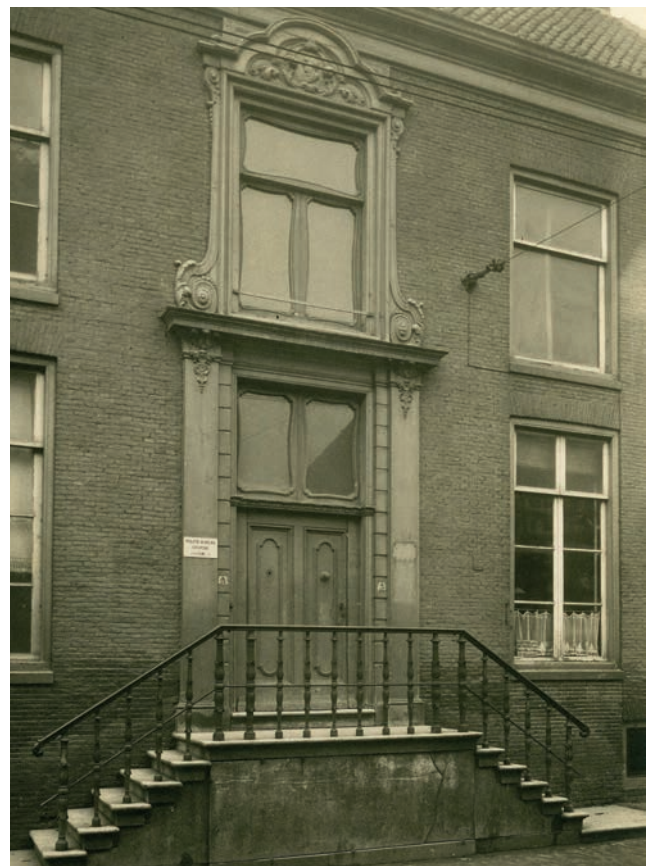
De gevelversiering boven de ingang van het huis aan de Heerenstraat dat later geplaatst is in het huis 'De Tangh'. Het pand deed dienst als politiebureau en als bureau van de gemeentelijke belastingdienst.