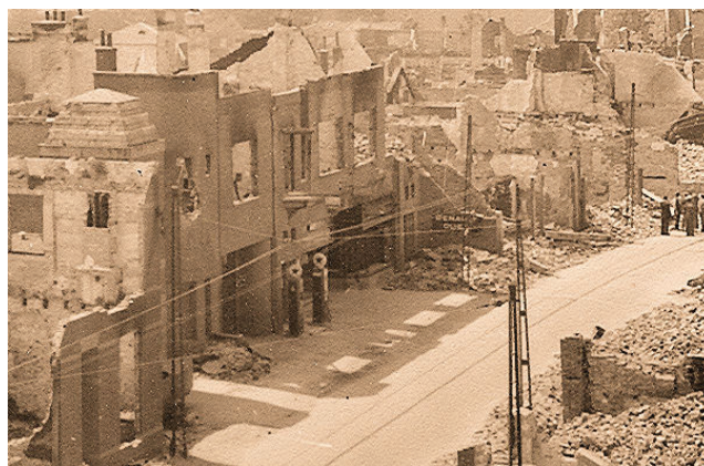
Detail van een foto met de Heerenstraat in mei 1940. Het puin is nog niet opgeruimd.