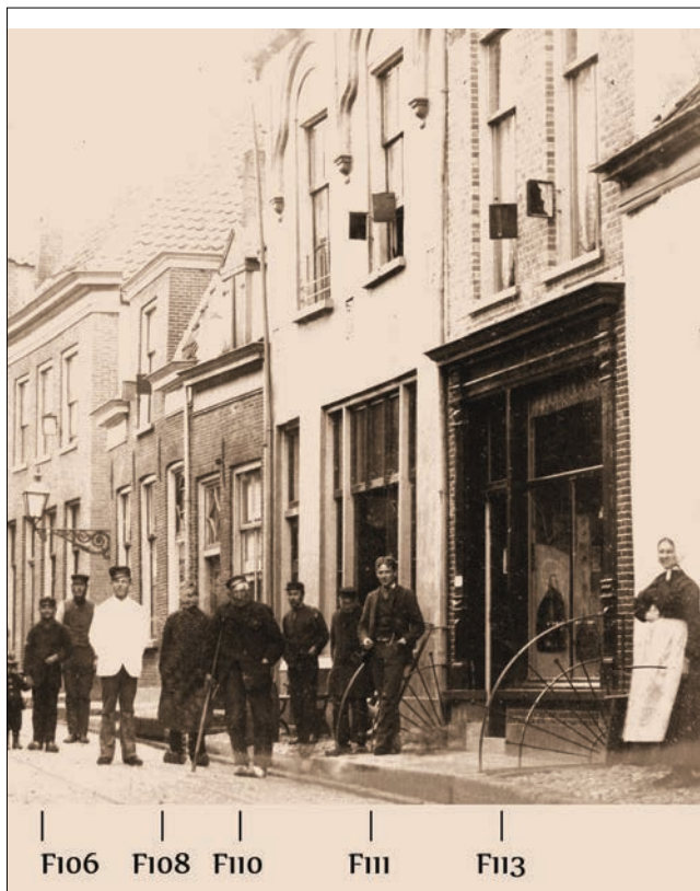
Heerenstraat ca. 1902. V.l.n.r. de panden F106; Van Deventerstraat; F108, F110, F111, F113. Nieuwe nummers F842; 840, 939, 838, 837. F110 heeft één muurancker.