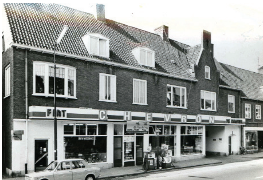
Garage De Rhoter, 1963, na de overname van Garage Van der Horst.