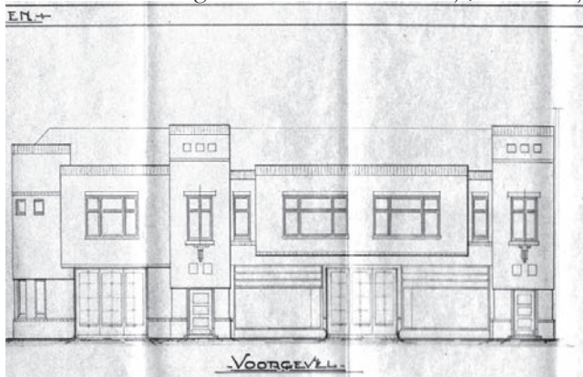
Bouwtekening van de nieuwe garage in 1925.

1932 in Rhenen begonnen met een taxibedrijf, waarna hij