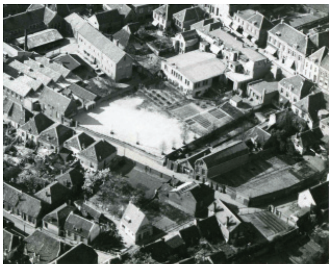
KLM-luchtfoto van 1930. Links de Heerenstraat. Het grote vierkant gebouw is de nieuwe garage, links daarvan het kantoor van Van Wijngaarden met verder links de tapijfabriek. In het kantoorgebouw zijn thans 3 appartementen ingebouwd.

1932 in Rhenen begonnen met een taxibedrijf, waarna hij