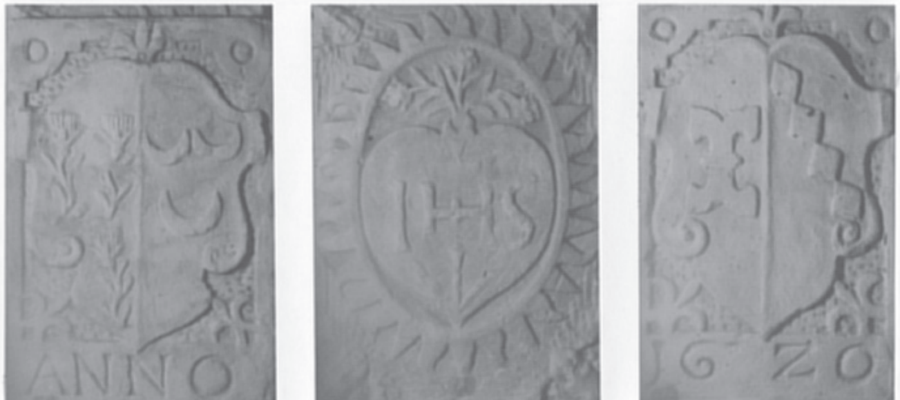
De drie gevelstenen

Op de derde gevelsteen komt een zuil voor, het wapen van bovengenoemde familie Verhuedt, aangetrouwd kennelijk aan een lid van een familie die een schuinbalk van aaneengesloten ruiten voerde. Hieraan hebben we nog geen familienaam kunnen koppelen. De familie Verhuedt te Rhenen was protestant. Van leden van deze familie hebben we wel zegels gevonden (zie januarinummer Oud Rhenen, pagina 16).