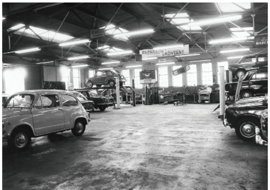
Interieur Garage de Rhoter aan de Herenstraat, met 6 hefbruggen..