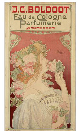
De originele poster van Boldoot, die zichtbaar is op de deurruit van Stolp.