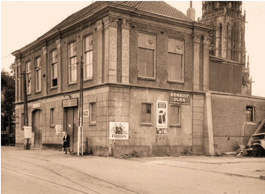
Garage De Rhoter in het oude pand van De Koning van Denemarken. Links was de deur van de brandweercentrale. Achter de persoon was de toegang tot de Garage en autoverhuur. Boven was het nog steeds de 'Zaal van Altena', waar feestpartijen, dans- en toneelavonden werden gehouden. Let op de tramrails, het stuk na de splitsing was bedoeld om de tram vanuit Zeist te laten wachten op de komende tram vanuit Arnhem. Ca.1936.