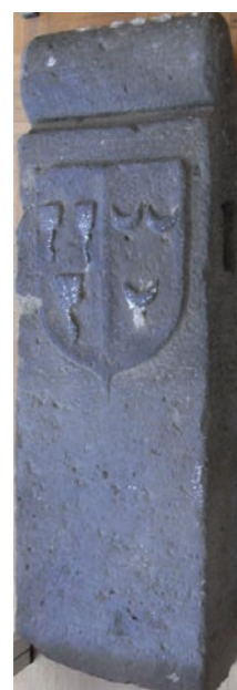
Stoeppaal met wapen in de Kruisstraat

In het huis er ten noorden naast hebben leden van de familie Vereest gewoond. De hypothese is dat we hier te maken hebben met het familiewapen Vereest. Op genoemde foto zien we ook een stoeppaal rechts voor dit huis. Bij verder inzoomen herkennen we een wapen met een kruis, het familiewapen (Vonck) van Lienden. Deze familie Vereest is na de Reformatie nog lang katholiek gebleven. Katholieken mochten begin 17 e eeuw geen functies in het stadsbestuur bekleden. Vandaar dat we dit wapen verder niet tegenkomen, bijvoorbeeld op zegels. Het wapen met de drie wassenaars, dat op het rechtergedeelte van de gevelsteen staat, zou kunnen duiden op een Van Utenweerde of Vastrick, gehuwd met een Vereest dus.