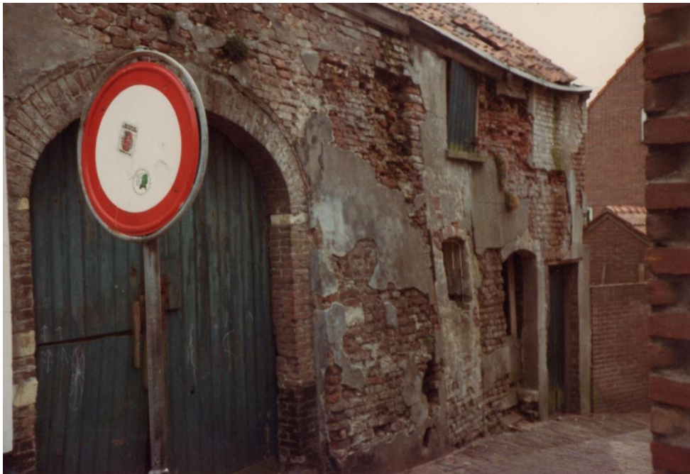
De Steile Steeg oost/west gezien, begin 80-er jaren, met de toegang tot schuur en achterterrein van ooit de herberg De Moriaen (foto Leo Schoonhoven)

Hieronder volgt de bewoningsgeschiedenis van deze oude Middeleeuwse herberg De Moriaen vanaf de 16 e eeuw.