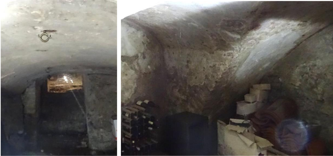
Een blik in de kelder van het huis voorheen De Moriaen gebeten anno 2021