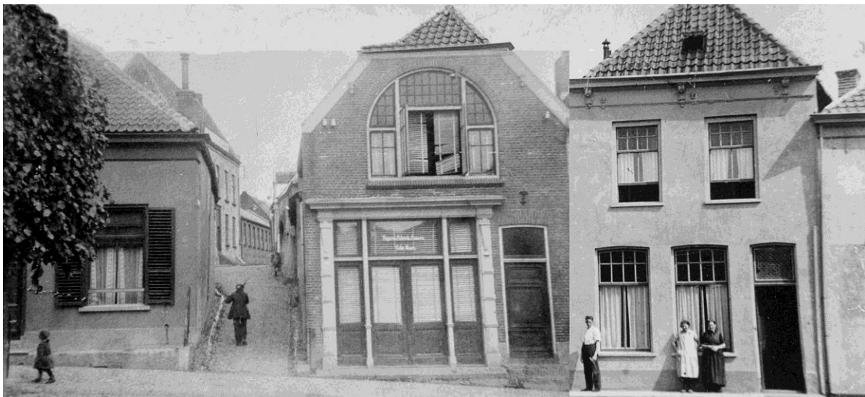
Een blik in de Steile Steeg, west/oost; rechts het huis oorspronkelijk de Moriaen gebeten. In 1940 bevond zich hier de sigarenfabriek van A. van Leeuwen

Het pand waarin zich oorspronkelijk de herberg De Moriaen bevond, heeft de bombardementen in 1940 en later doorstaan; enkele jaren geleden is het huis gerenoveerd. De middeleeuwse kelders blijken er nog steeds onder te zitten.