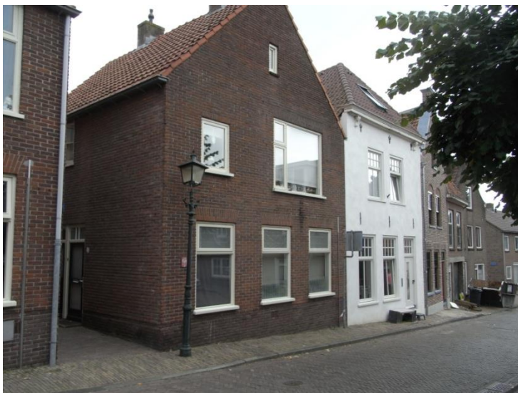
Het witte huis, ooit De Moriaen, is omstreeks 2021 grondig gerenoveerd