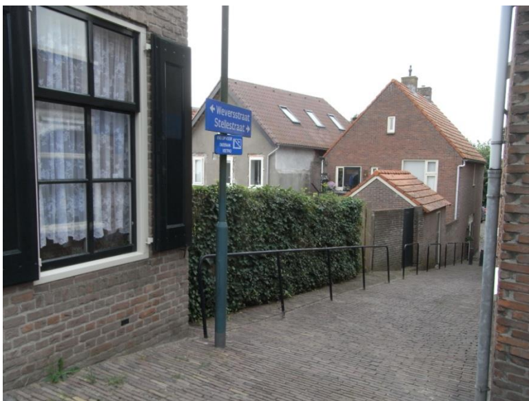
De Steile Steeg oost/west gezien anno 2021