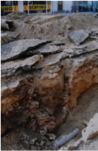
De Generaalsput tijdens rioolwerkzaamheden in 1993

Later werden wezen meestal bij particulieren of familie ondergebracht en werden deze hiervoor betaald door de Gast- en Weeshuismeesters. Onlangs werd in de Stadsrekeningen (8) en de Policieboeken (met ordonnanties van de magistraet) gevonden dat in 1613 opdracht werd gegeven tot de bouw van de 'Generaalsput'. Zo lezen we in de Stadsrekeningen van 1613/4 het volgende: