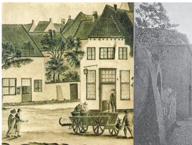
Herberg De Swaen, hier links op een detail van de tekening van Haakman (ABR 212), de steunbeer rechts is ook zichtbaar op de foto

Van deze oude herberg de Swaen bestaan nog oude afbeeldingen en zelfs foto's. Rond 1900 werd de herberg aan het Hof afgebroken en vervangen door nieuwe, hogere bebouwing. We hopen over de bewoningsgeschiedenis van deze oude herberg nog eens separaat te publiceren.