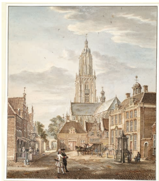
Tekening van Jan de Beijer uit ca. 1745 met de Markt en het huis Thiell

De herberg Thiell aan de Markt in Rhenen kwam al een aantal malen ter sprake. Hieronder vervolgen we met de bewoningsgeschiedenis vanaf de 17 e eeuw tot aan de totale verwoesting door bombardementen tijdens de Tweede Wereldoorlog.