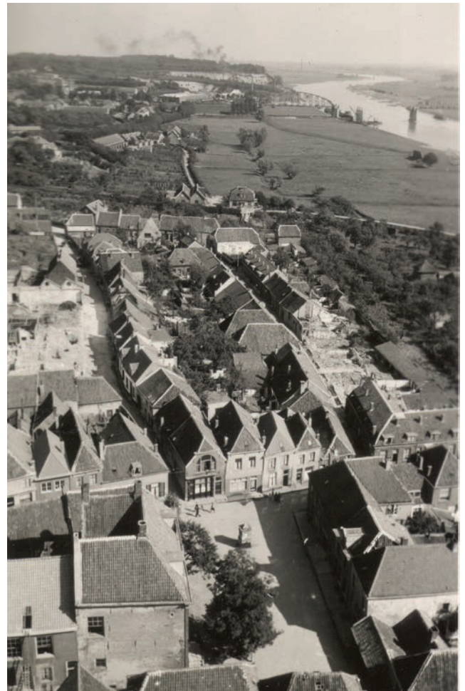
Foto vanaf de Cuneratoren in 1940. Rechts in het midden, met dakkapel, het huis F874

Gerardus de Vrind, ca. 1890