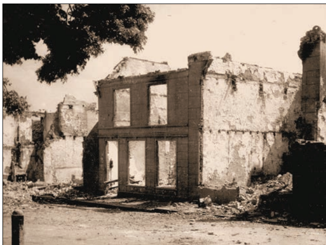
Restant van de woning F874, ca. 1945/1946