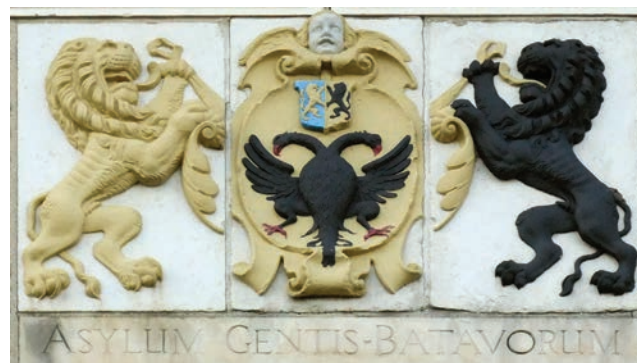
Stadswapen van Tiel uit de 17e eeuw; gevelsteen boven de Waterpoort in Tiel