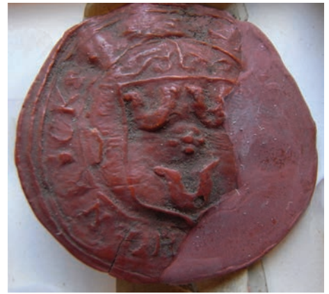
Links: Het 17 e eeuwse wapen Van Ijsendoorn met de drie hoefijzers (uit het wapenboek van Gelders Overijsselse studenten).