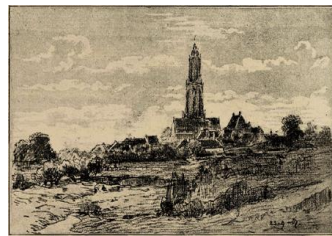
Zicht op Rhenen