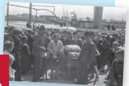
Stads museum Rhenen

Getuigenissen, films, foto's en voorwerpen illustreren de unieke verhalen vanaf de 15e eeuw tot en met nu, met het accent op de Tweede Wereldoorlog! Met voorwerpen die voor het eerst geëxposeerd worden onder andere een bijzondere bruikleen van het Universiteitsmuseum Utrecht.